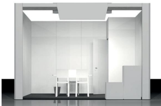
ST086 STAND IN LINEA (UN LATO APERTO) Ipotesi da 16 m 2