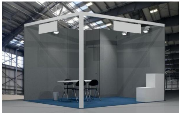
ST132 STAND AD ANGOLO (DUE LATI APERTI) Ipotesi da 16 m 2