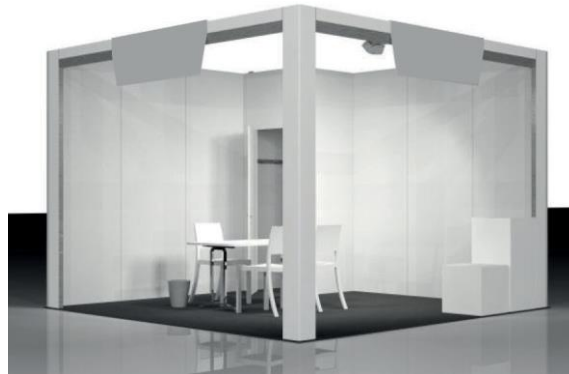
ST086 STAND AD ANGOLO (DUE LATI APERTI) Ipotesi da 16 m 2